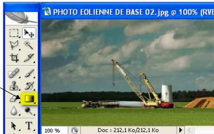
Dégradé sur calque en mode de fusion : lumière tamisée