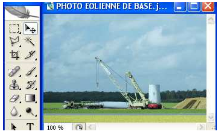
Image de base